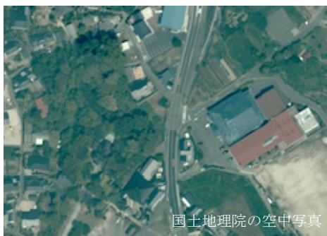
国土地理院の空中写真

でまえじゅぎょう おとす ひらおちょうりつき がしょうがっこう むろつはんとう むろつはんとう じょうもん 出前授業で訪れた平生町立佐賀小学校は、室津半島にあります。この室津半島は、縄文 時代、弥生時代、古墳時代の遺跡が存在する場所です。代表的な遺跡として、縄文時代の いわた いせき 遺跡 、弥生時代の ふきこしいせき 吹越遺跡 、古墳時代の しらとりこふん 白鳥古墳 、 あただこふん 阿多田古墳 、 じんがやまこふん 神花山古墳 があります。特に県内 さいだい しらとりこふん さがしょうがっこう しょうめん 最大の白鳥古墳は、まさに佐賀小学校の正面にあります。