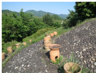
こうえんぶ はにわ 後円部の埴輪