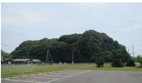
じんがやまこふん ぜんけい 神花山古墳の全景