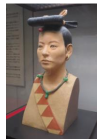
らくげん しょうおうそう 復元された女王像 撮影場所：平生町歴史民俗資料館

やまぐちほくぶつかん じょうもん やよい こふんじだい しゅつどひん てんじ 山口博物館では、縄文・弥生・古墳時代の出土品などが展示されています。ぜひご覧ください。