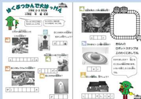
小学校2、3年生用ワークシート