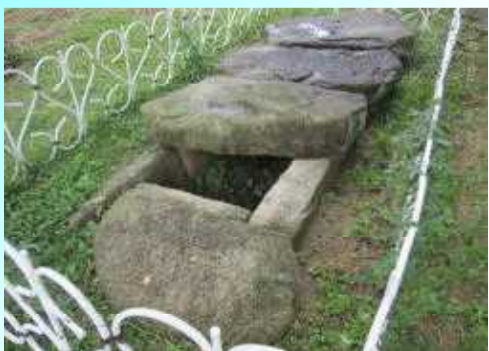
かつて厚東川河口にあった円墳から郷土資料館に移設されました。