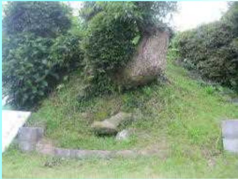
宗方温泉前バス停より北へ100m