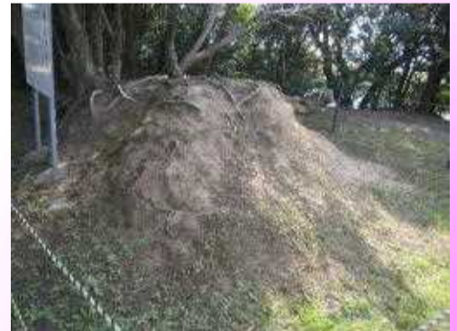
亀浦跨線橋より南東へ300m