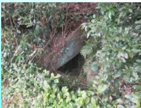
持世寺温泉入口バス停より西へ100m