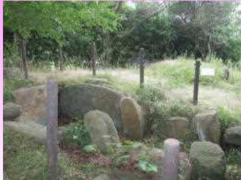
若宮海水浴場の西端にて