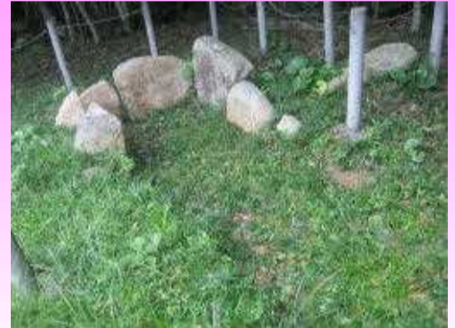
若宮海水浴場の東端にて