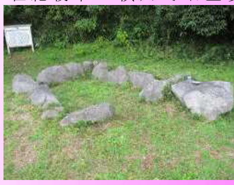
秋芳南中学校の敷地内

古代の山陰道の駅 「なっとくニュース130号」 の続きです。 ⑥三隅駅(旧三隅町) ⑦由宇駅(長門市深川湯本) ⑧意福駅(美祢市於福町) ⑨鹿野駅(美祢市大嶺町) ⑩阿津駅(美祢市厚保) ⑪厚狭駅(旧山陽町) で、古代の山陽道に合流。