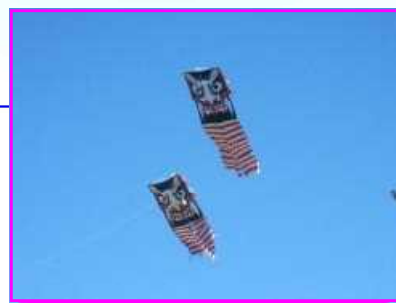
10月に見島で行われた 全国風揚げ大会で、鬼 揚げが上っていました。

積石塚が200基近くあり、その数の多 さから、朝廷より派遣された防人(兵士) たちのお墓とも考えられています。