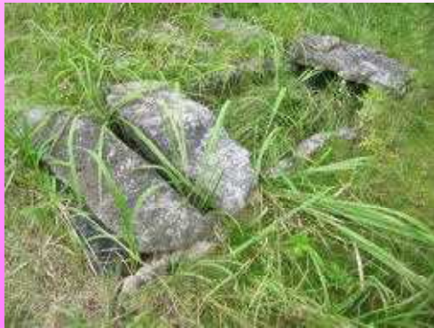
美祢図書館南側の川沿い