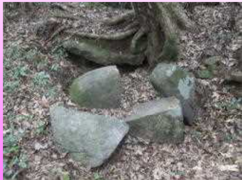
西八幡宮より西へ100m

見島ジークンボ古墳群 国指定史跡 (萩市見島) 7世紀後半(大化の改新以後) ～10世紀初め(平安時代前期) の群集墳