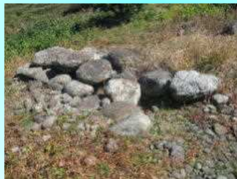
見島本村港より東へ900m

見島ジークンボ古墳群 国指定史跡 (萩市見島) 7世紀後半(大化の改新以後) ～10世紀初め(平安時代前期) の群集墳