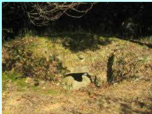
向津具八幡宮より西へ100m