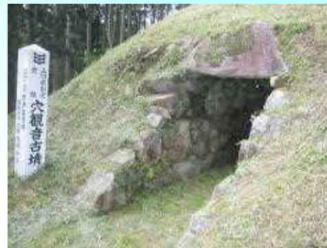
むつみコミュニティセンターより 南西へ1km

あな かん のん こふん 穴観音古墳 県指定史跡 (萩市高佐下) 6世紀末～7世紀初めの方墳