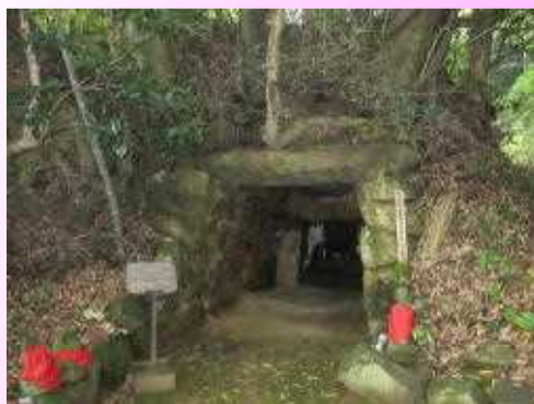
おおいえき 大井駅より東へ200m

えんこうじあな かん のん こふん 円光寺穴観音古墳 市指定史跡 (萩市大井) 6世紀末～7世紀初めの方墳