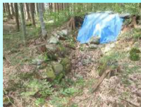
ふくが ちゆうざいしよ 福賀駐在所より南へ200m

あな かん のん こふん 穴観音古墳 県指定史跡 (萩市高佐下) 6世紀末～7世紀初めの方墳