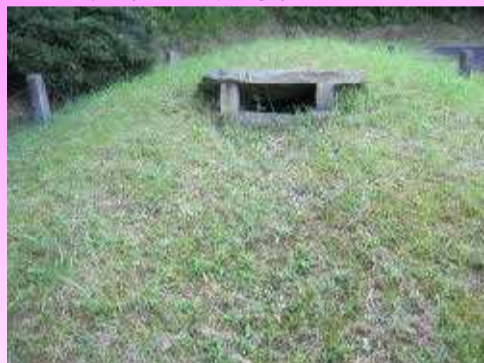
たまがわちようみん 田万川町民センターより 北東へ100m