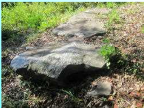
ごこくじんじや 護国神社にて

えんこうじあな かん のん こふん 円光寺穴観音古墳 市指定史跡 (萩市大井) 6世紀末～7世紀初めの方墳