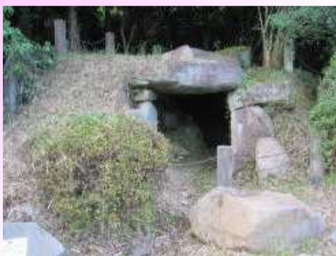
しもおがわ 下小川ふれあいセンターより 北東へ100m