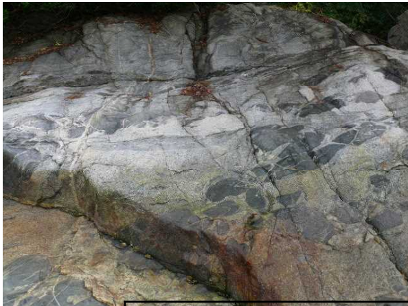
黒っぽい岩石を取り込んだ白い岩石とそのアップ (黒っぽい石…角閃岩、白い石…花こう岩)