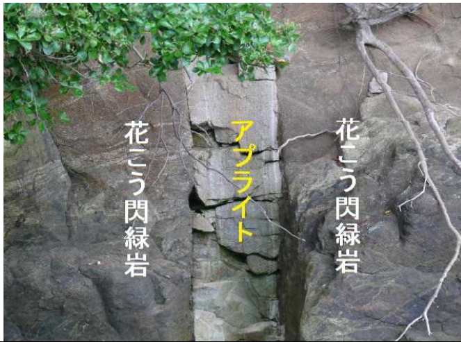
黒っぽい岩石をつらぬいた白い岩石 (アプライト (細粒花こう岩) の貫入)