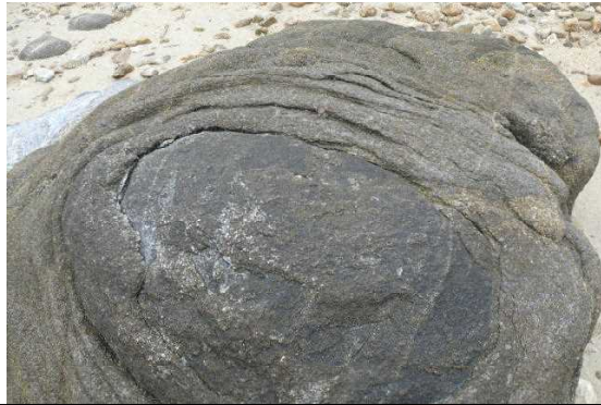
たまねぎのように風化した岩石 (花こう閃緑岩のたまねぎ状風化)