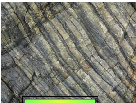
しましまの岩 (珪質片麻岩)