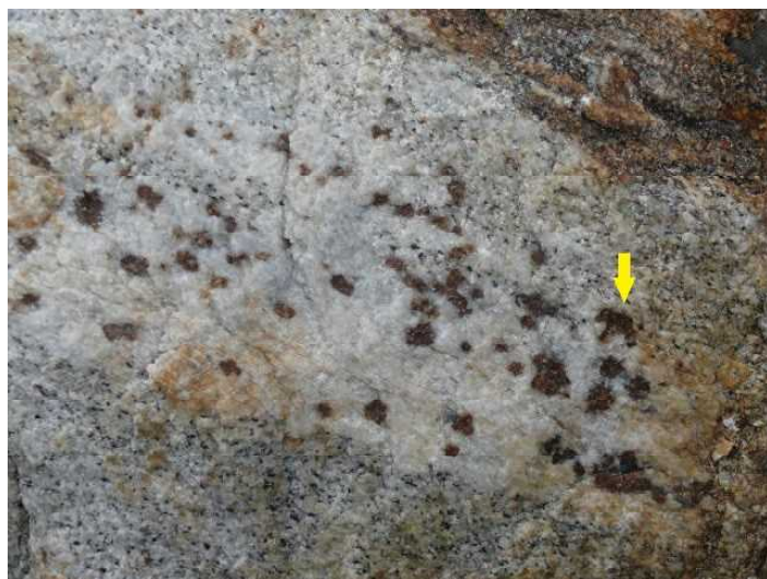
白い岩石の中にある赤いシミのような岩石 (ざくろ石。きれいな結晶はガーネットと言われます。)