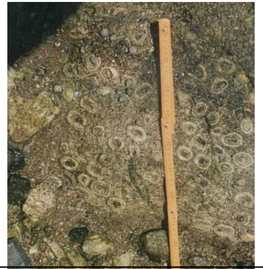
前回も紹介した球状花こう岩