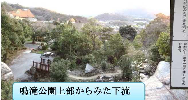
鳴滝公園上部からみた下流