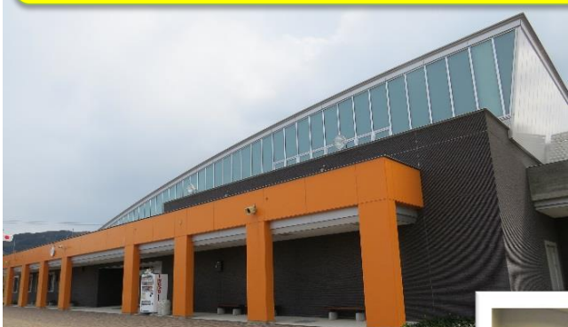
「山口県大島防災センター」・・・防災の拠点です。

約1億年前にできた岩石（変成岩）が、地下に押し込められてできたもので、過去に岩盤に強い力が加わったことがよくわかります。