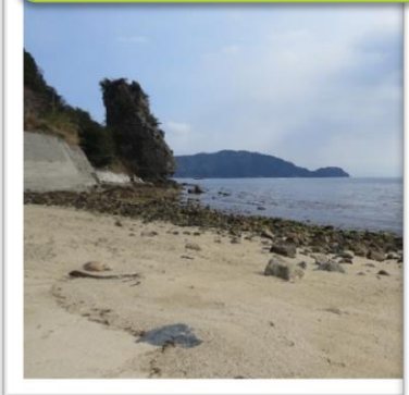
海岸に突然あらわれる岩脈「立岩」・・・マグマの通り道

貝？ 繭（まゆ）？・・・ではなく、周防大島のとある海岸に見られる不思議な形の岩石です。貴重なものなので、見るだけにしておきましょう。