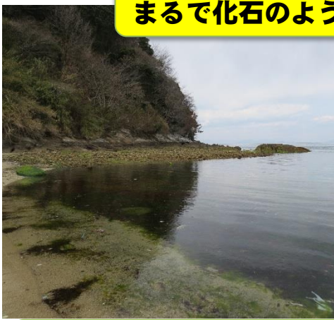
まるで化石のような「球状花こう岩」

周防大島町では、長い時間をかけてできた不思議な岩石が見られます。また町内の久賀地区には「山口県大島防災センター」があり、地震や津波のでき方や防災について学べる施設があります。ちょうど訪ねた日の未明に山口県東部で震度5弱の地震があり、まさに「 活きている地球 」と「 防災の大切さ 」を実感してきました。3/14