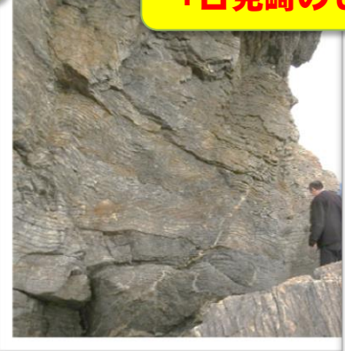
「日見崎のしゅう曲」地層の折れ曲がり

花こう岩の中を上昇してきたマグマの通り道（岩脈）が残ったもの。高さ約40mの安山岩です。瀬戸内火山岩といわれています。