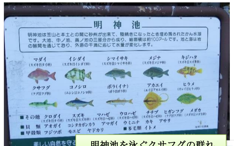
明神池を泳ぐクサフグの群れ