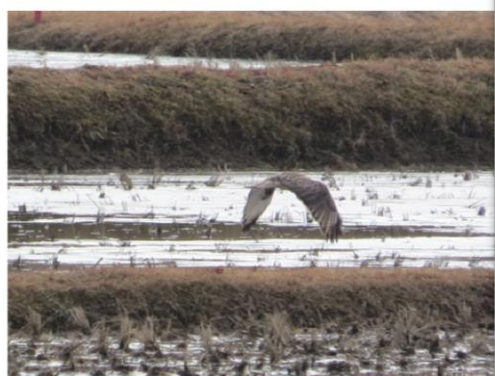
猛禽類は飛んでいる姿も絵になります。まさに悠然・・・。