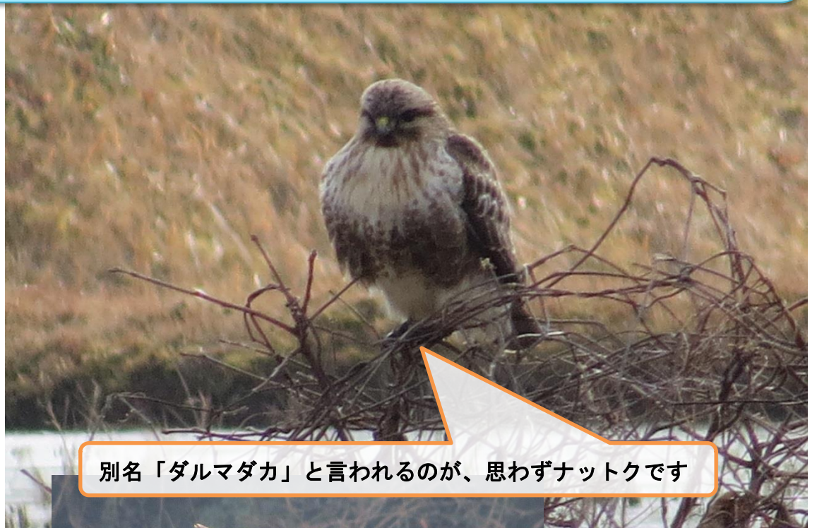
別名「ダルマダカ」と言われるのが、思わずナットクです