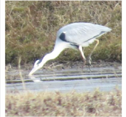
近くにアオサギも飛んできました。