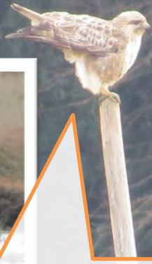
この姿勢はもしや・・・！ そうです。フンをしたのです。ちゃんと！？おしりあげてます。