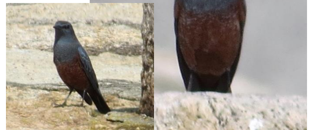
宇部市丸尾海岸で見かけた イソヒヨドリ 。青い羽根でよく目立ちます。