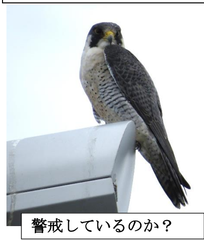
警戒しているのか？

つ しぜんかん のしま自然館の指導員 しどういん の方に、「ハヤブサ」が見られる場所 かた がある、と聞いてはいたものの、まさかいきなり であ 出会うとは・・・カラス？(ハヤブサは猛禽類 もうきんるい の中では小型 なか なので)と思いながら、そーっと近づいて ちか 見るとやっぱり「ハヤブサ」。真下 み に行っても逃げ出さず、大サービス おも してくれました。祝島 いわいしましゅうへん 周辺や山口湾 やまぐちわん にもいるらしいのですが、今まで いま 出会えませんでした。さすがに世界最速 せかいさいそく の急降下 きゅうこうか は見られませんでした。それにしてもカッコイイ！！ますますファンになりました。(10/7 撮影)