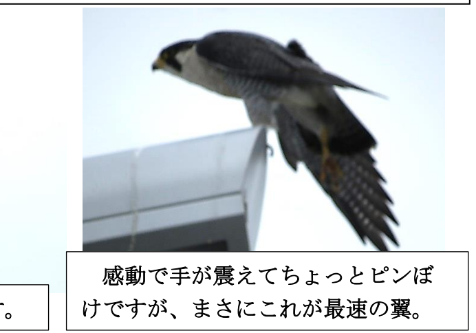
感動で手が震えてちょっとピンぼけですが、まさにこれが最速の翼。