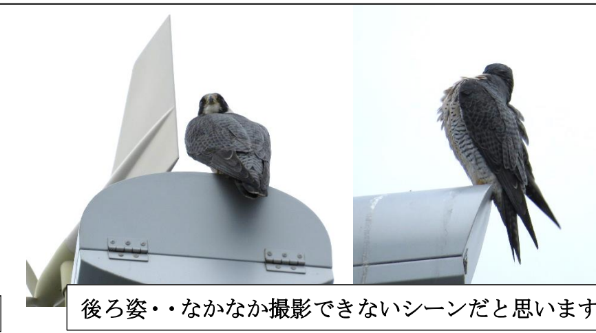
後ろ姿・・・なかなか撮影できないシーンだと思います。