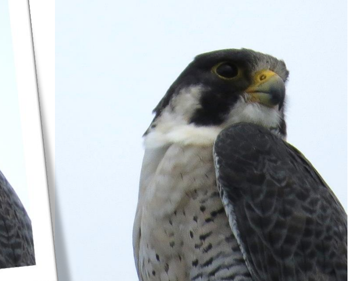
ハヤブサの三面写真。この目で上空から獲物を見つけ、最高で時速 300 km以上でダイブ。すごい視力と運動能力で主に鳥を狙います。

つ しぜんかん のしま自然館の指導員 しどういん の方に、「ハヤブサ」が見られる場所 かた がある、と聞いてはいたものの、まさかいきなり であ 出会うとは・・・カラス？(ハヤブサは猛禽類 もうきんるい の中では小型 なか なので)と思いながら、そーっと近づいて ちか 見るとやっぱり「ハヤブサ」。真下 み に行っても逃げ出さず、大サービス おも してくれました。祝島 いわいしましゅうへん 周辺や山口湾 やまぐちわん にもいるらしいのですが、今まで いま 出会えませんでした。さすがに世界最速 せかいさいそく の急降下 きゅうこうか は見られませんでした。それにしてもカッコイイ！！ますますファンになりました。(10/7 撮影)