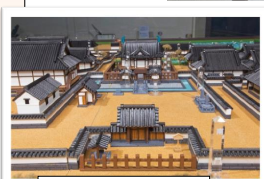
博物館の明倫館模型