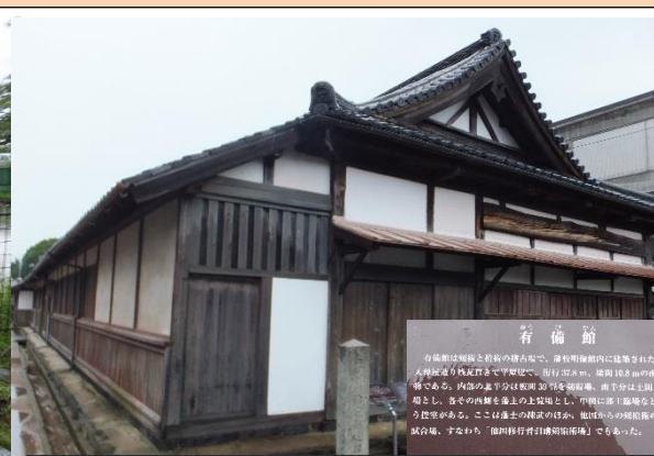
正門付近にある剣術と槍術の稽古場だった「有備館」。これも国の史跡。