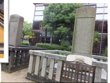
国の史跡に指定されている「明倫館の碑」