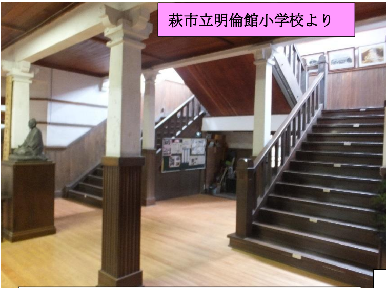
萩市立明倫館小学校より