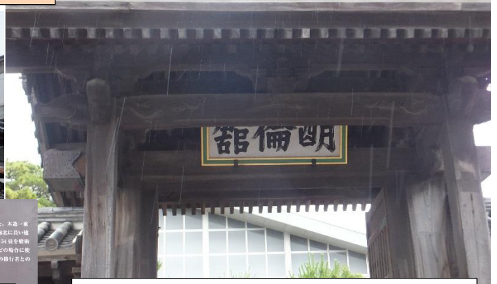
これは、萩市指定有形文化財の明倫館南門（正門）の遺構。

校舎内や中庭は、特別に許可を得て撮影したもので、一般には公開していません。史跡は見学できますが、平日は事務室での届けが必要です。駐車不可。