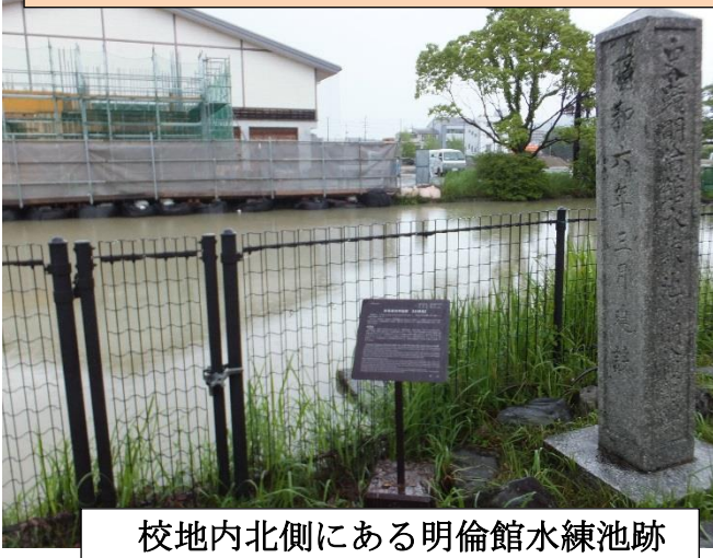
校地内北側にある明倫館水練池跡