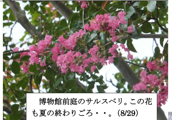
博物館前庭のサルスベリ。この花も夏の終わりごろ・・・。(8/29)