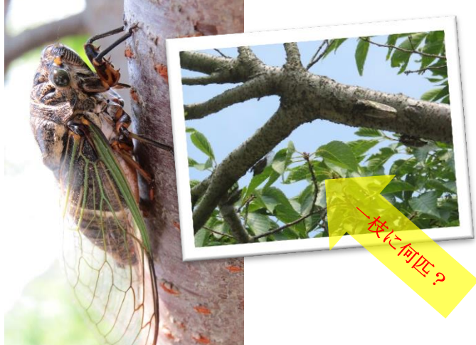
7月には山口市周防大橋のたもと（幸崎公園）でクマゼミが大量発生。(7/27)

あつ なんと い なつ ちい あき あしおと 「暑い！」と何度言ったかわからない夏！でも小さい秋の足音が・・・