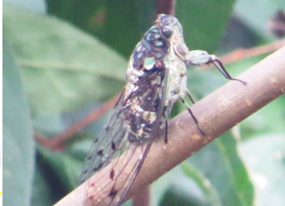
声は有名ですが、案外姿を見せないミンミンゼミ。山口市錦鶏（きんけい）の滝にて（8/23）