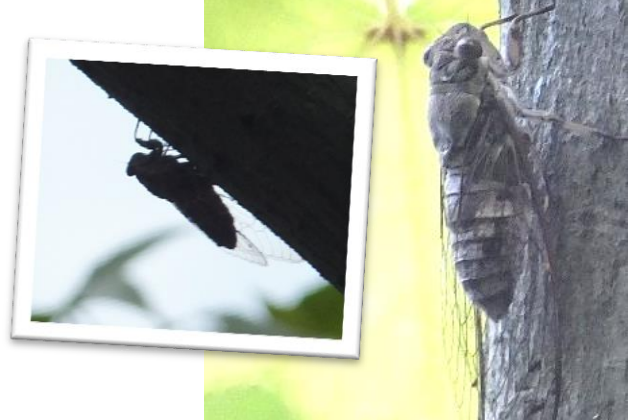
ツクツクボウシが博物館の前で毎日元気よく鳴いています。夏の終わりのハーモニー？（8/20）

それにしても暑かったこの夏。 太陽熱で地球の表面から大量に蒸発した水分は、地球のどこかに降り注ぐこととなります。 地球上の水のほとんどは海にあります。実は大気中のわずかな水分が私たちの生活に大きな影響を与えています。