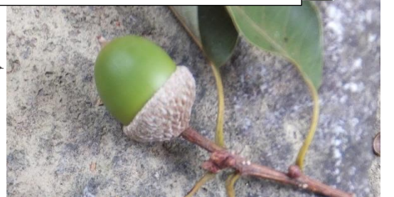
そろそろ裏山のドングリ（写真はコナラ【ブナ科】の果実）も秋を迎える姿になってきました。(8/29)