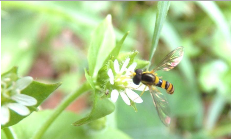
ウシハコベの花にとまるハナアブのなかま。ホバリング（空中停止）が得意です。