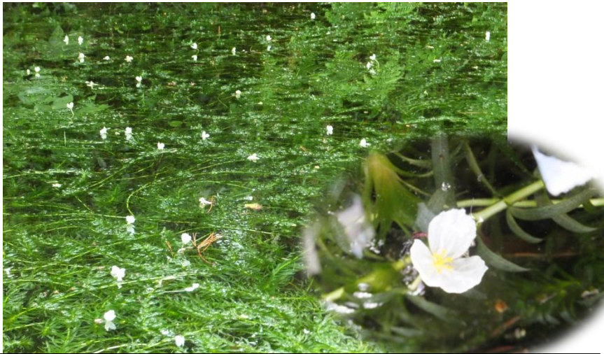
オオカナダモの花が満開です。種子植物ですよ。