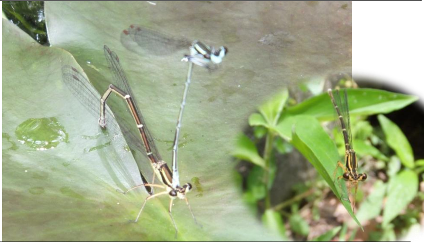
産卵中のモノサシトンボ（上がオス）。たしかに胸のようがモノサシみたいです。