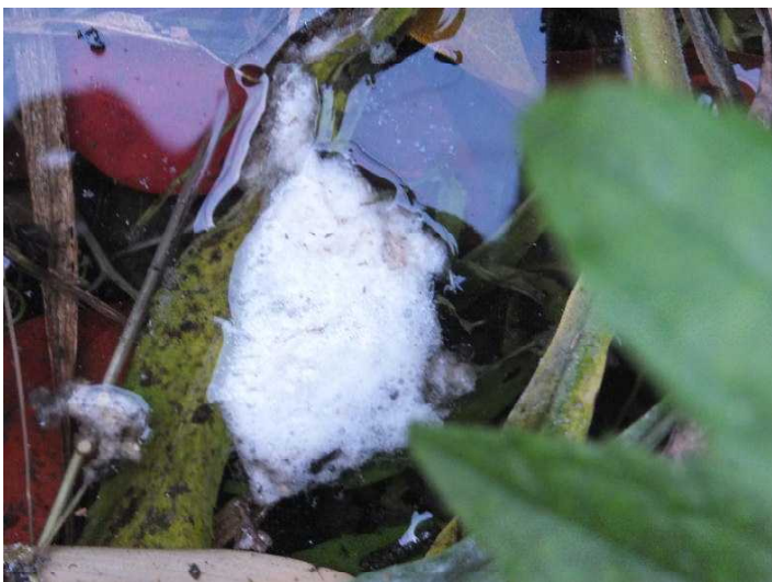
(2013年5月3日下松市切山で撮影)